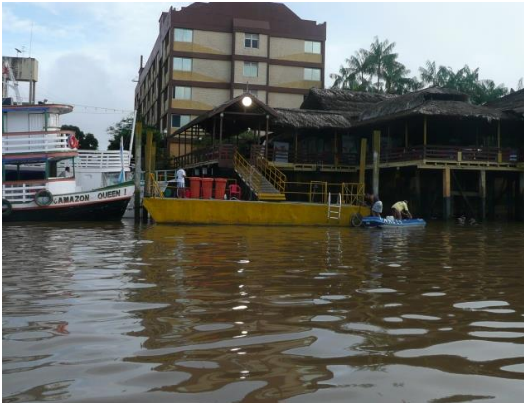
Dinghy dock de l'hôtel Beira Rio

Les quelques plaisanciers qui s'y retrouvent peuvent aussi s'arranger entre eux pour gardiennner alternativement les bateaux