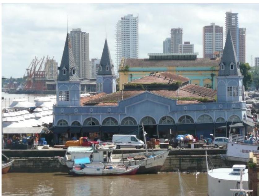
Marché Ver O Peso

Les restos de l'Estacion das docas (face ouest de la ville) sont sympas (micro brasserie)