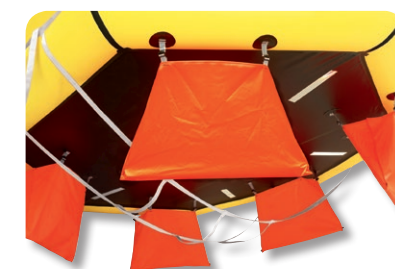
Modèle photographié : Transocéan ISAF 6 personnes.

• Plage de température de gonflement Non visible à l'œil nu, ce critère est extrêmement important : les navigateurs hauturiers et les coureurs "tour-du-mondistes" veilleront à sélectionner un radeau dont les températures de gonflement sont compatibles avec les zones de navigation fréquentées.